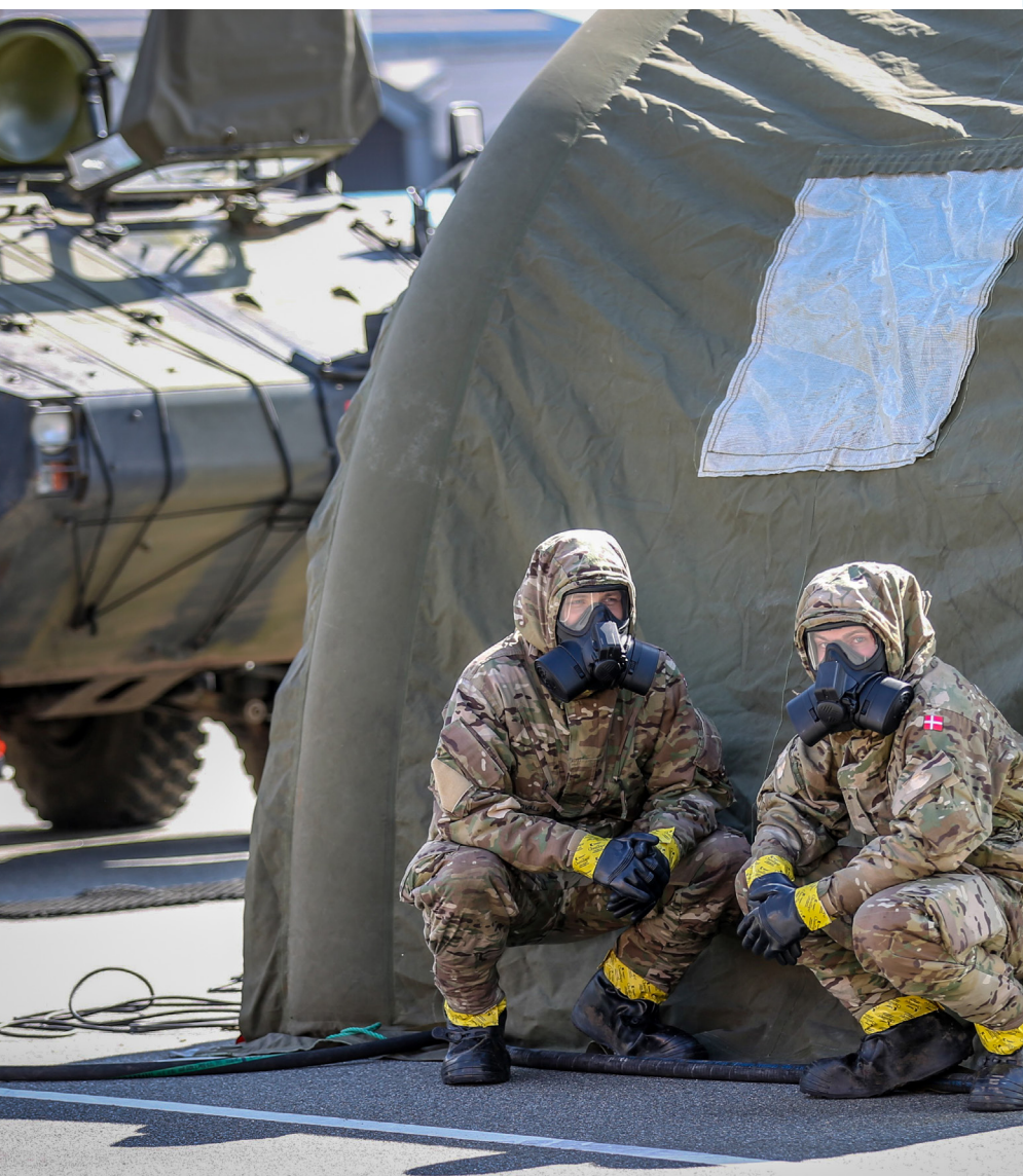
CBRN & GEOKMP på CBRNE-øvelse med Nationalt Beredskab i Esbjerg, 16. april 2024.

NATO's og EU's krav og forventninger til dansk modstandsdygtighed